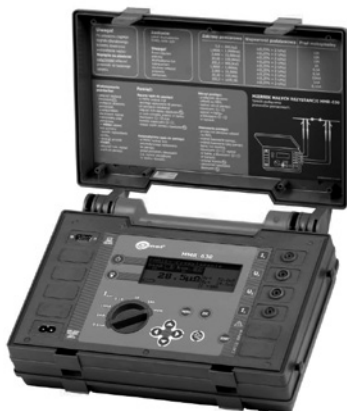
Obr. 10. Mikroohmmetr MMR 630

Obecně je možné rozdělit mikroohmmetry podle minimálního měřicího rozsahu na přístroje s rozlišením 0,1 a 1 \mu\Omega . Nejmenší hodnoty odporů jsou měřeny zpravidla proudem 10 A. Přístroje umožňují volbu odporového a indukčního režimu měření (podle předpokládané zátěže) a mají ochranu vstupních obvodů do 440 V. Typickým představitelem může být např. přístroj MMR 630 s rozlišením 0,1 \mu\Omega (obr. 10) a měřicím rozsahem do 2 k \Omega .