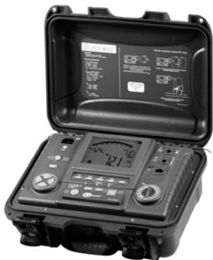
Obr. 4. Měřič izolačních odporů MIC 5010

Přístroje s rozšířenými funkcemi jsou určeny zpravidla ke speciálním měřením izolačních odporů s možností vyhodnocení nestandardních stavů měřeného zařízení. Kromě uvedených vlastností vyhodnocují také např. polarizační index, dielektrický absorpční poměr, dielektrický vybíjecí index, vykonávají zkoušku v předem nastavené posloupnosti napětí s vyhodnocením izolačního odporu v závislosti na čase funkcí R = f(t) apod.