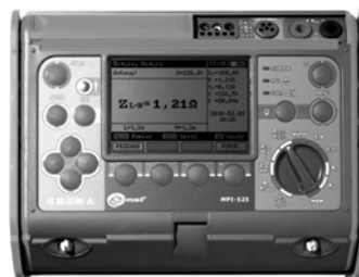
Obr. 6. Sdrúžený revizní přístroj Sonel MPI 525 (měření izolačních odporů napětím 2,5 kV)

Funkcí umožňující měření propojení elektrického obvodu proudem 200 mA jsou vybaveny také moderní přístroje určené k testování proudových chráničů, měření impedance smyčky a většina sdružených a kombinovaných revizních přístrojů předních evropských výrobců (např. Sonel, Metrel, Chauvin Arnoux, Megger apod.).