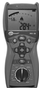
Obr. 3. Měřič izolačních odporů Sonelec MIC 30

Měřiče izolačních odporů mají zpravidla zabudovanou funkci měření přechodových odporů proudem 200 mA, což je možné použít při revizi spotřebičů a nářadí podle ČSN 33 1600 ed. 2 Revize a kontroly elektrického ručního nářadí během používání . Obecné připojení měřicích kabelů při měření izolačních odporů je uvedeno na obr. 2.