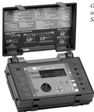
Obr. 7. Měřič impedance smyčky Sonel MZC 310S

Standardní měřiče impedance smyčky měří dvou vodičovou metodou s max. rozlišením 0,01 \Omega . Minimální měřitelné hodnoty vzhledem k uváděným nejistotám mohou být diskutabilní (tato otázka je někdy pokládána u zkoušek revizních techniků). Uvážíme-li dvou vodičové měření, je problematické zpřesnit měření nebo zvýšit rozlišení (LSB).