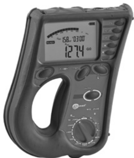
Obr. 5. Měřič izolačních odporů MIC 2510

Mezi přístroje s rozšířenými funkcemi s testovacím napětím až do 5 kV lze zařadit např. řadu měřičů izolačních odporů Sonel MIC 5005 a MIC 5010. Novinkou je také např. měřič izolačních odporů Metrel MI 3200, který umožňuje měření napětím do 10 kV. Uvedené přístroje vyhodnocují automaticky, ve vztahu k nastavené teplotě, také uvedené činitele PI, DAD, DD.