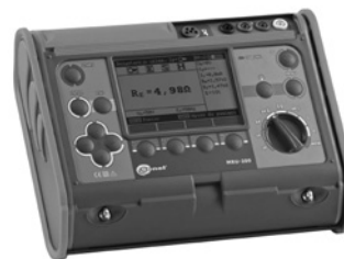
Obr. 8. Měřič zemních odporů MRU 200

Měřicí přístroje určené k měření zemních odporů a specifického odporu půdy jsou konstruovány podle EN 61557-5 Elektrická bezpečnost v nízkonapěťových rozvodných sítích se střídavým napětím do 1 000 V a se stejnosměrným napětím do 1 500 V – Zařízení ke zkoušení, měření nebo sledování činnosti prostředků ochrany – Část 5: Zemní odpor.