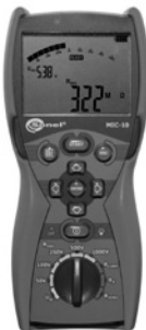
Obr. 1. Měřič izolačních odporů Sonelec MIC 10