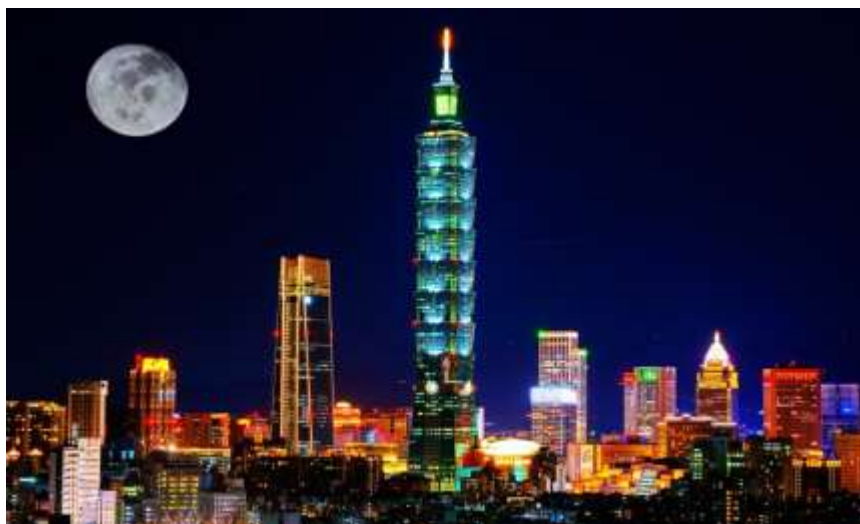
Obrázek 3: Taipei 3