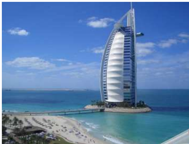
Obrázek 2: Dubaj 2

Ať se jedná o Londýn, Madrid, Frankfurt, Vídeň nebo Paříž. V letní sezóně je dokonce zaveden přímý spoj do amerického města New York, ale to není jediný dálkový spoj, který se provozuje z Prahy, další jsou například : Dubai, Soul anebo Taipei.