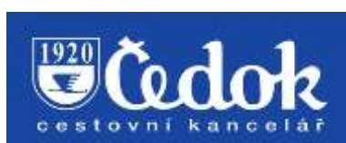
Obrázek 11: logo Čedok 10