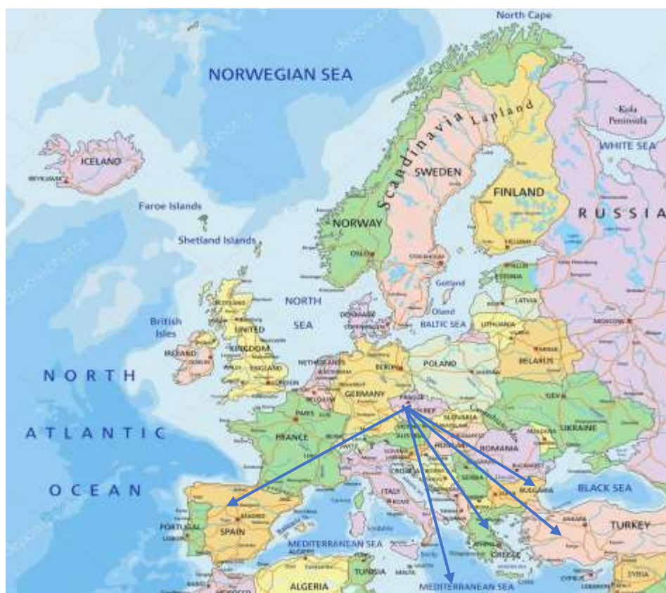
Obrázek 13: destinace 12

I z jiných zemí by mohli cestovní kanceláře poskytovat zájezdy do Českých Budějovic a města Český Krumlov. Tím by došlo ke spolupráci letiště a zahraničních cestovních kanceláří. Dále by toto mohlo vést k exotickým destinacím, které by pořádaly zahraniční cestovní kanceláře s přestup na jejich letišti odkud by pokračovaly do dané exotické destinace.