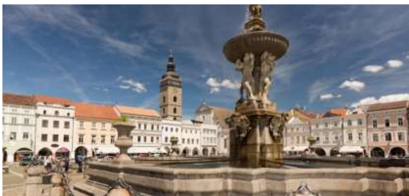
Obrázek 4: Náměstí Přemysla Otakara II.