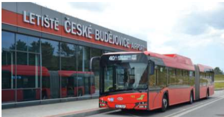
Obrázek 5: autobusová doprava na letiště 4

Doprava na letiště v Českých Budějovicích v dnešní době není na moc dobré úrovni, jelikož letiště ještě není v provozu.