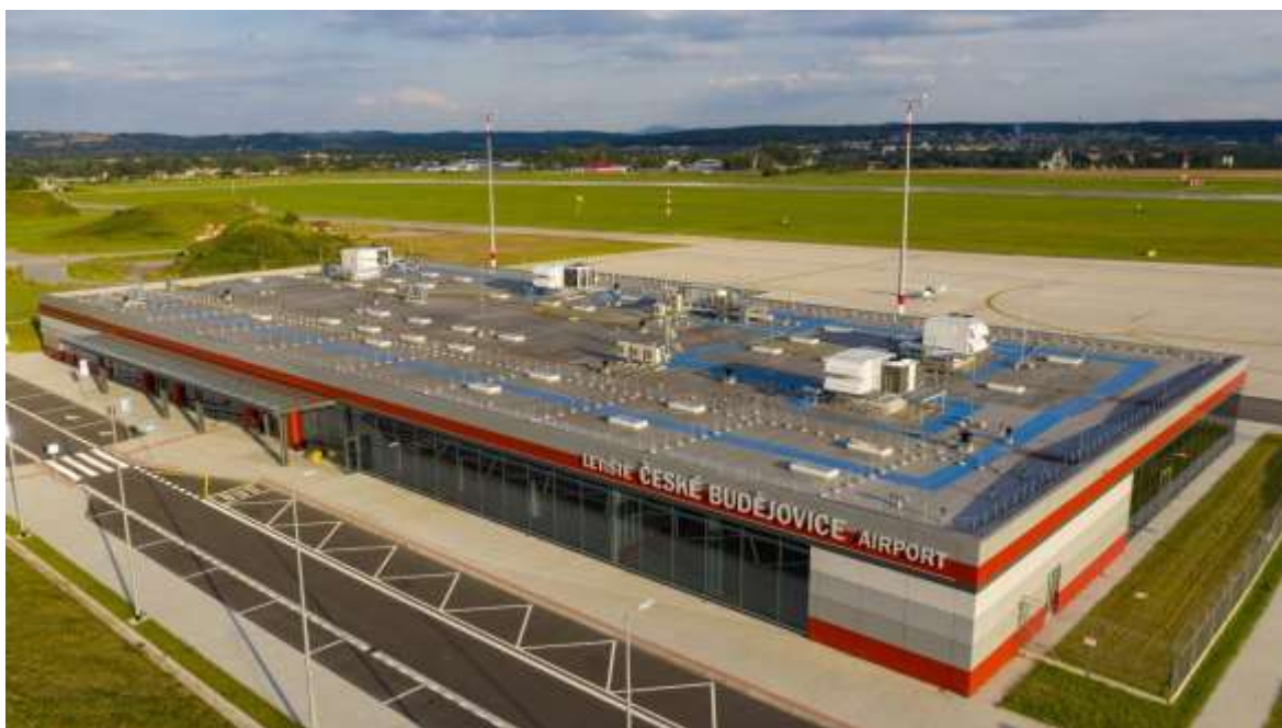
Obrázek 10: letiště České Budějovice 9

V nové letní sezóně 2024 letiště České Budějovice přivítá lidi až z Jihlavy anebo z Plzně. Tato zpráva je pro letiště dobrou vizitkou spolehlivosti. Dále by to taky mohlo přinést více leteckých společností, které by poté zavést novou pravidelnou linku.