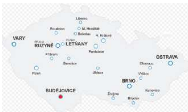
Obrázek 8: Mapa České republiky 7

Letiště České Budějovice se samozřejmě nachází v České republice, v jihočeském kraji. Přesněji se letiště nachází na jihu od statutárního města České Budějovice. Letiště České Budějovice je vyznačeno na mapě červeným kroužkem.