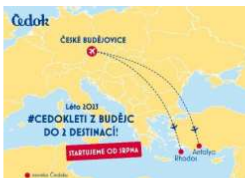
Obrázek 9: Reklama Čedoku na lety z Českých Budějovic 8

Jediný problém, který v dnešní době sužuje letiště jsou právě, již zmíněné letecké společnosti. V půlce roku 2023 vyšel článek, kde SmartWings oznamují konec létání z regionálních letišť jako je právě letiště v Českých Budějovicích. Naštěstí se díky velkému zájmu cestování SmartWings opět vrátili do Českých Budějovic.