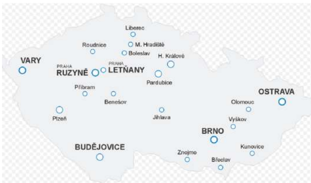
Obrázek 1: Mapa měst s letištěm v rámci ČR. 1

Letecká vnitrostátní doprava v rámci České republiky je zbytečná. Jelikož do všech krajských měst většinou vede železnice a je mnohem rychlejší než využití letecké dopravy a zároveň je mnohem levnější.