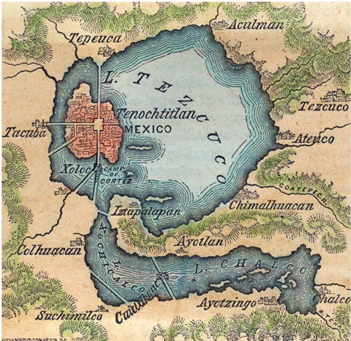
Obrázek 3- mapa aztéckého města