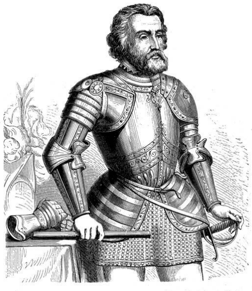
Obrázek 2- Hernán Cortés

V roce 1522 ho španělský král Karel V. jmenoval místodržícím a nejvyšším soudcem a vrchním velitelem Nového Mexika. Pomocí mnichů se zavádělo mezi domorodci křesťanství. Ve Španělsku byl obviněn ze zneužívání moci a byla na něj poslána kontrola, proto se vrátil do Španělska, kde mu Karel V. udělil v roce 1528 titul Markýz del Valle de Oajaca a obdaroval ho velkými pozemky v Mexiku.