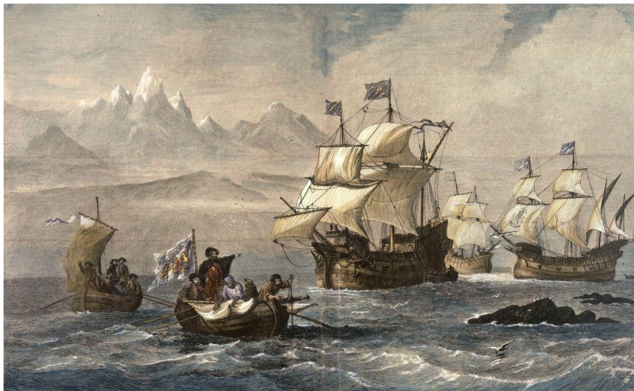
Obrázek 4 - flotila Fernao de Magalhaese

Jak asi mohly tyto lodě vypadat. Pomůžeme si lodí jménem Viktorie , ve které v roce 1522 obeplul svět Fernao de Magalhaese. Byla to karaka, dlouhá 28 metrů, široká 8,5 metru s výtlakem 80-90 tun. Karaka byla v té době obchodní i válečná loď, ze které se později vyvinula galeona. Tyto lodě nebyly nijak typizovány, každá loď byla originál. Karaka byla trojstěžník, 30-40 metrů dlouhý, měla vysoké boky a velkou nosnost 1000 až 2000 tun. Měla 4 paluby a ponor 5 metrů. Rychlost při příznivém větru byla 10 uzlů (18,5 km/h). K řízení sloužilo kormidlo, kormidelník přes plachty neviděl na cestu a spoléhal se na pokyny hlídky na stěžni. Loď se vyráběla z borového nebo dubového dřeva. Trup byl pečlivě vymazán smolou, přesto do lodi zatékalo a voda se musela odčerpávat.